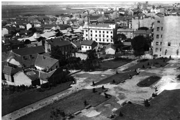
Слика 3 Теразијска падина, Београд, око 1930.