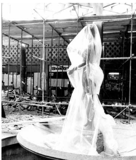
Слика 7 Владета Максимовић, Пролаз Безистан, Теразије, Београд, 1953; Реконструкција Безистана крајем осамдесетих година XX века.